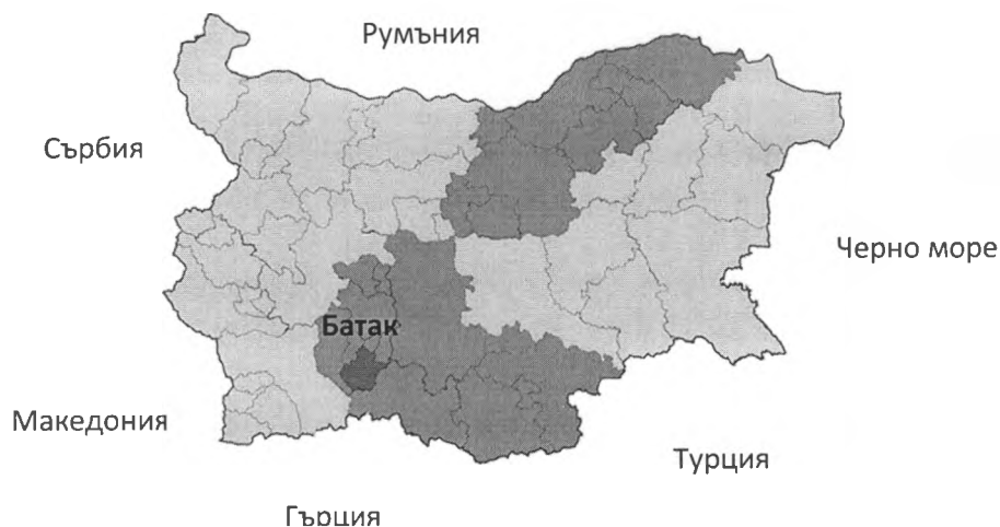
Карта с местоположението

Главната водна артерия е река „Стара река”. Община Батак е една от общините в България с най-много изградени язовири: „Язовир Батак”, „Голям Беглик”, „Беглика”, „Тошков чарк”, „Широка поляна” и „Дженевра”. Около язовирите „Батак”, „Беглика” и „Широка поляна” е изградена широка мрежа от почивни бази – хотели, почивни станции, къмпинги и други.