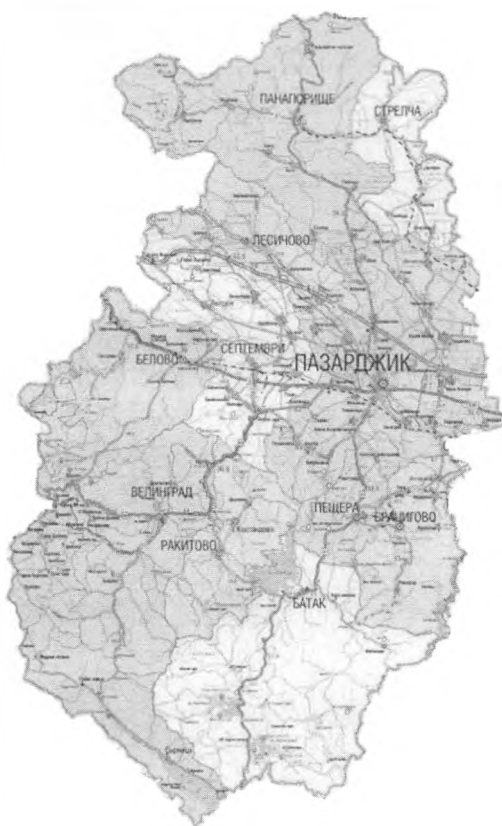
Разположение на община Батак в област Пазарджик

Община Батак е с площ от 677.31 кв. км и население по постоянен адрес от 6 508 души (данни към 15.12.2018 г.). Тя включва град Батак (3 186 жители), село Нова махала (2 667 жит.), село Фотиново (655 жит.) . Общината е част от област Пазарджик и попада в Южен централен район за планиране. Община Батак е в област Пазарджик.